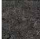
121-059 Plumb Grey NCS S 7502 - B