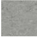
121-053 Ice Grey NCS S4502-B