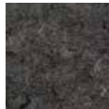
121-059 Plumb Grey NCS S 7502 - B