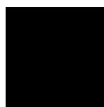
NCS S 9000-N