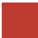
NCS S 2070-Y90R

Täcklackerad MDF: Lådfronter och dörrar.