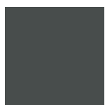
NCS S 7502-G